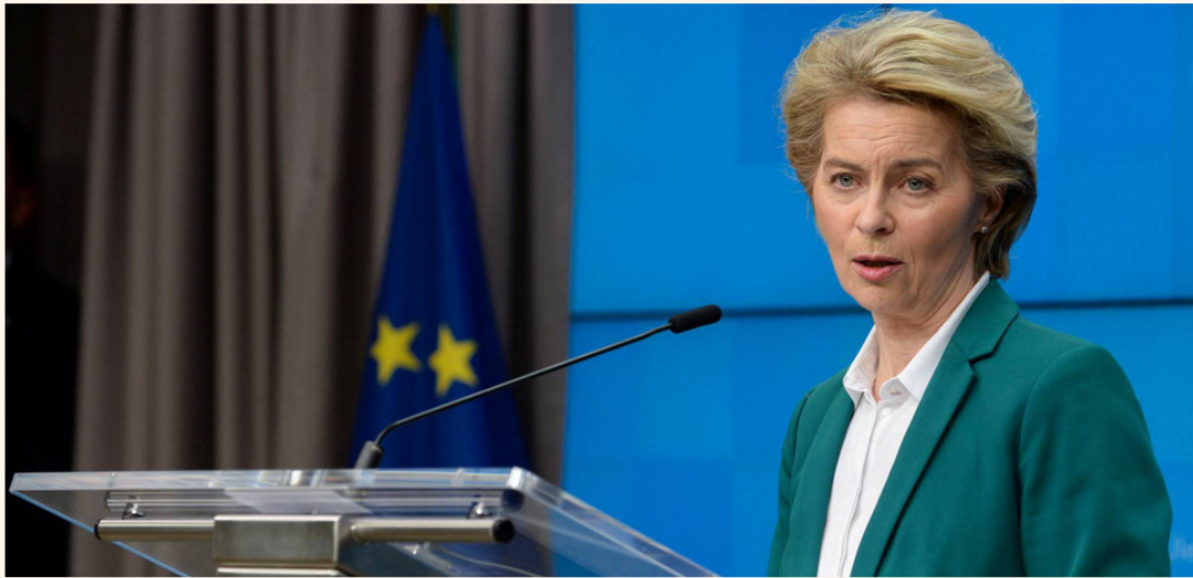
Ursula von der Leyen, presidenta de la Comisión Europea.